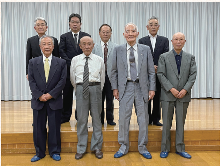
令和3年6月には、理事・監事の役員が選任されました。