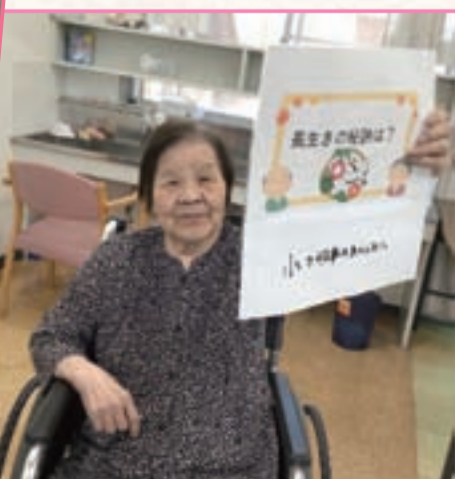
小さいことは気にしない