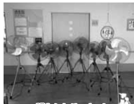
購入したサーキュレーター