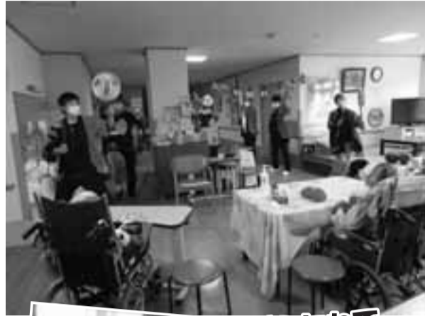
特製うちわで気分はどんちゃん♪