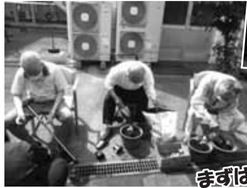
まずはていねいに土を入れて...