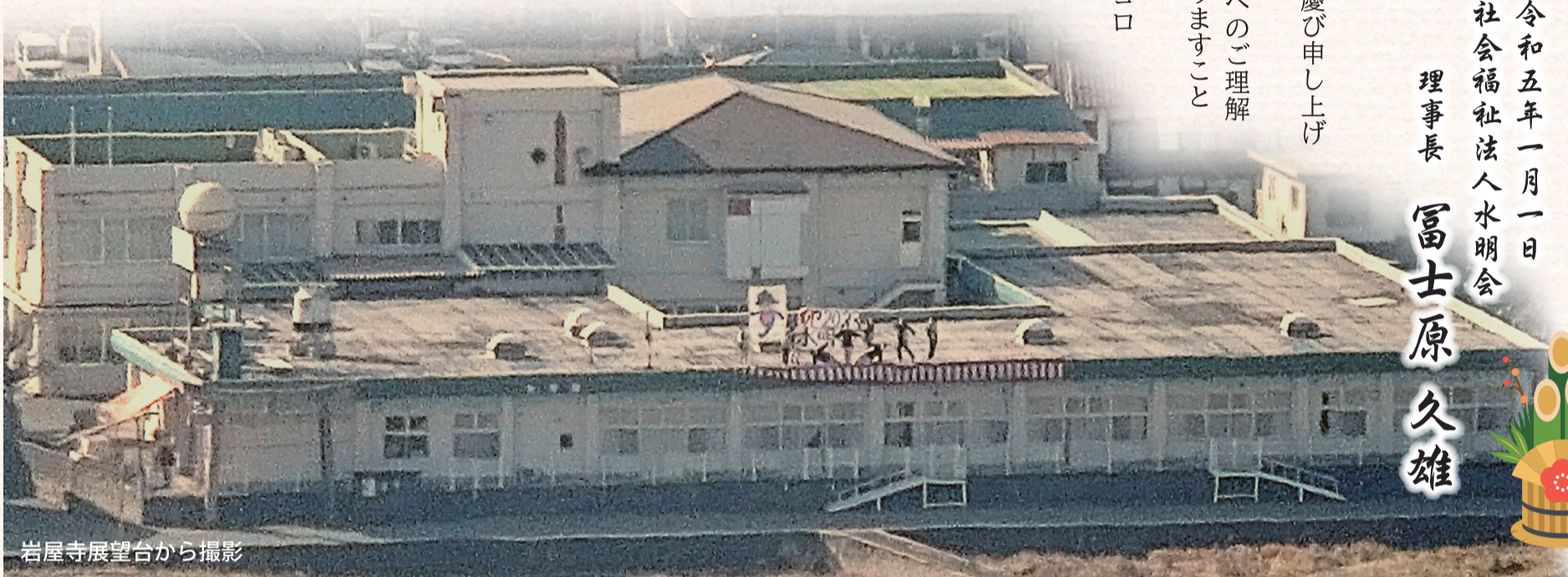
岩屋寺展望台から撮影