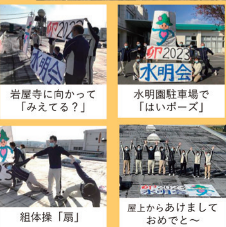
岩屋寺に向かって「みえてる？」